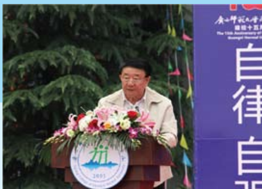
5月23日全国人大常委、全国人大教科文卫委员会副主任委员、民进中央副主席、中国民办教育协会会长王佐书出席第三届桂台高等教育高峰论坛暨广西师范大学漓江学院办学15周年成果展开幕式