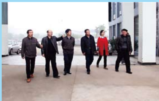
1月5日自治区教育厅副厅长蔡昌卓、桂林市副市长巫家世一行莅临学校调研