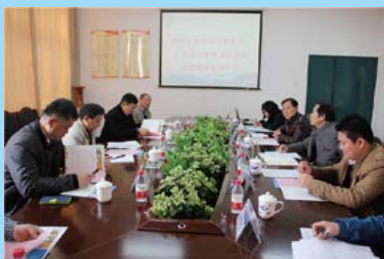
3月1日广西民办教育协会考察组莅临学校调研工作