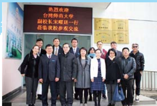
12月13日台湾师范大学副校长宋曜廷一行访问学校