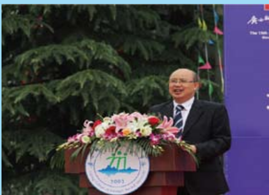
5月23日自治区教育厅副厅长蔡昌卓出席第三届桂台高等教育高峰论坛暨广西师范大学漓江学院办学15周年成果展开幕式