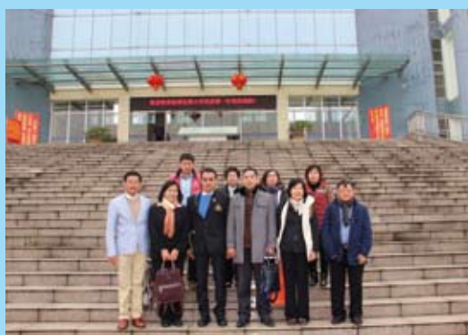
3月11日泰国孔敬大学代表团访问学校