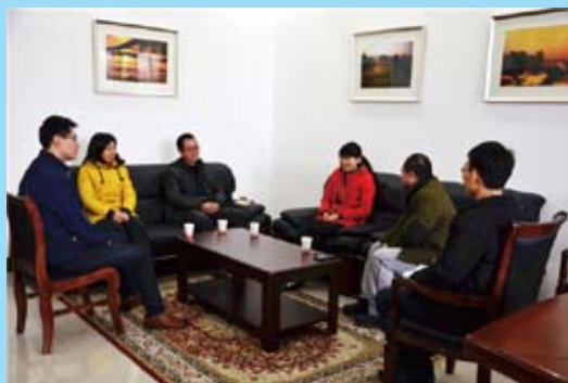
1月16日自治区教育厅高教处副处长杨曦莅临学校调研