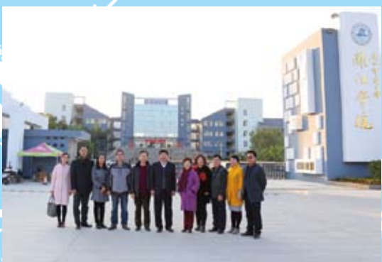
12月1日对外经济贸易大学原校长施建军一行到学校访问交流